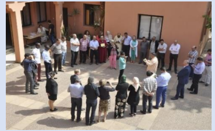
Vielfalt-Training mit marokkanischen und deutschen Kommunen, Marrakesch 2017.

IMAP begleitete die Konzeption, Methodik und Moderation von Workshops zum Thema „Integration von Migranten“ in Marrakesch mit marokkanischen und deutschen Kommunen inkl. interkulturellen Trainings. Hintergrund des Projektes war die steigende Zahl von Geflüchteten aus Subsahara-Afrika in Marokko und Tunesien. Neben dem Wissensaufbau zu integrationsspezifischen Themen dienten die Workshops auch dem Erfahrungsaustausch zwischen deutschen und marokkanischen bzw. tunesischen Kommunen.