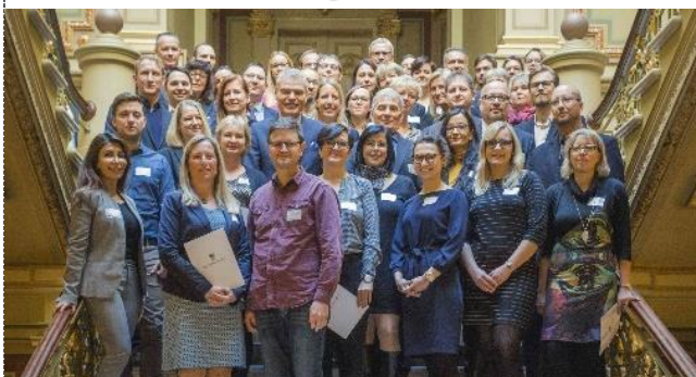
Abschlussveranstaltung WiSA mit Innenminister Holger Stahlknecht, Magdeburg 2018