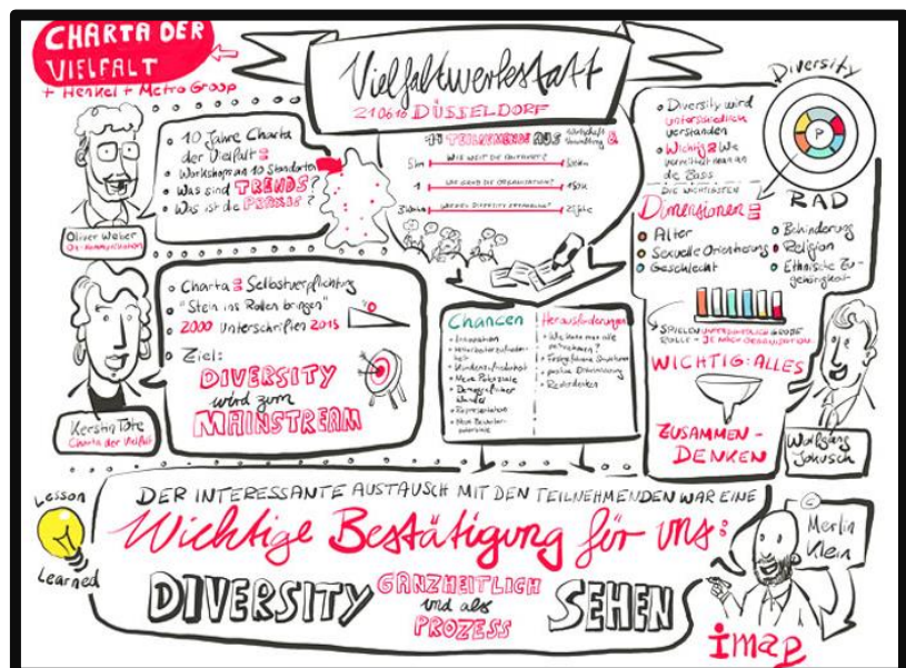
Graphic Recording: Dokumentation eines Workshops im Rahmen der Veranstaltung der Charta der Vielfalt, 2016. Autor: Merlin Klein/IMAP

Der abgebildete IMAP Kulturkompass hilft maßgeblich dabei, Organisationskultur sowie Stärken und Entwicklungsrichtungen einer Organisation, eines Teams oder einer Führungskraft zu erfassen.