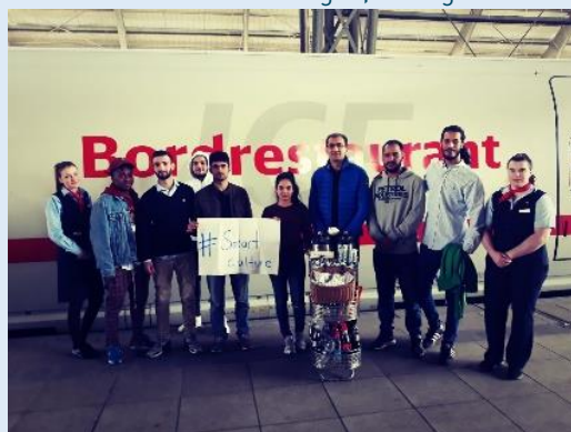
Smart Culture Training bei der Deutschen Bahn, Hamburg, 2018

Die Qualifizierung der jeweiligen Zielgruppe erfolgt dabei in Kombination von unterschiedlichsten, den Bedarfen der Zielgruppe angepassten, Veranstaltungs- und Trainingsformaten. Schwerpunkt innerhalb der Module ist das praktische Beispiel der eigenen Arbeitskultur und die Reflexion anderer Arbeitskulturen.