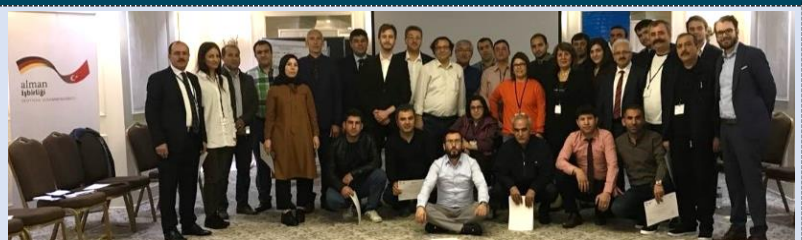
Training für Mitarbeitende und Führungskräfte der Arbeitsagentur ISKUR, Türkei, 2018.

Das GIZ-Projekt in der Türkei zielt darauf ab, den Zugang syrischer Geflüchteter sowie türkischer Bürgerinnen und Bürger zum Arbeitsmarkt durch eine verbesserte Kooperation der Arbeitsmarktagentur ISKUR mit türkischen nationalen Institutionen sowie ausgewählten nichtstaatlichen Akteuren zu vereinfachen.